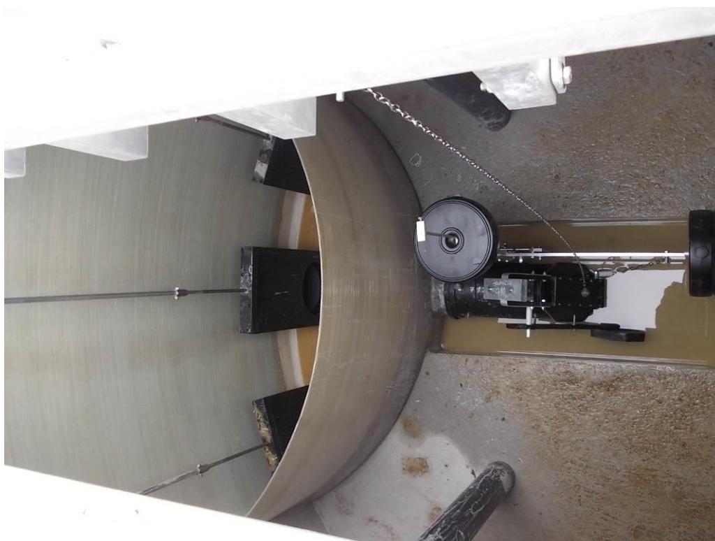
Vue de dessus cloison posée avec les équipements installés : Mobile de chasse simple et système de répartition intégré (RVI DN 250)