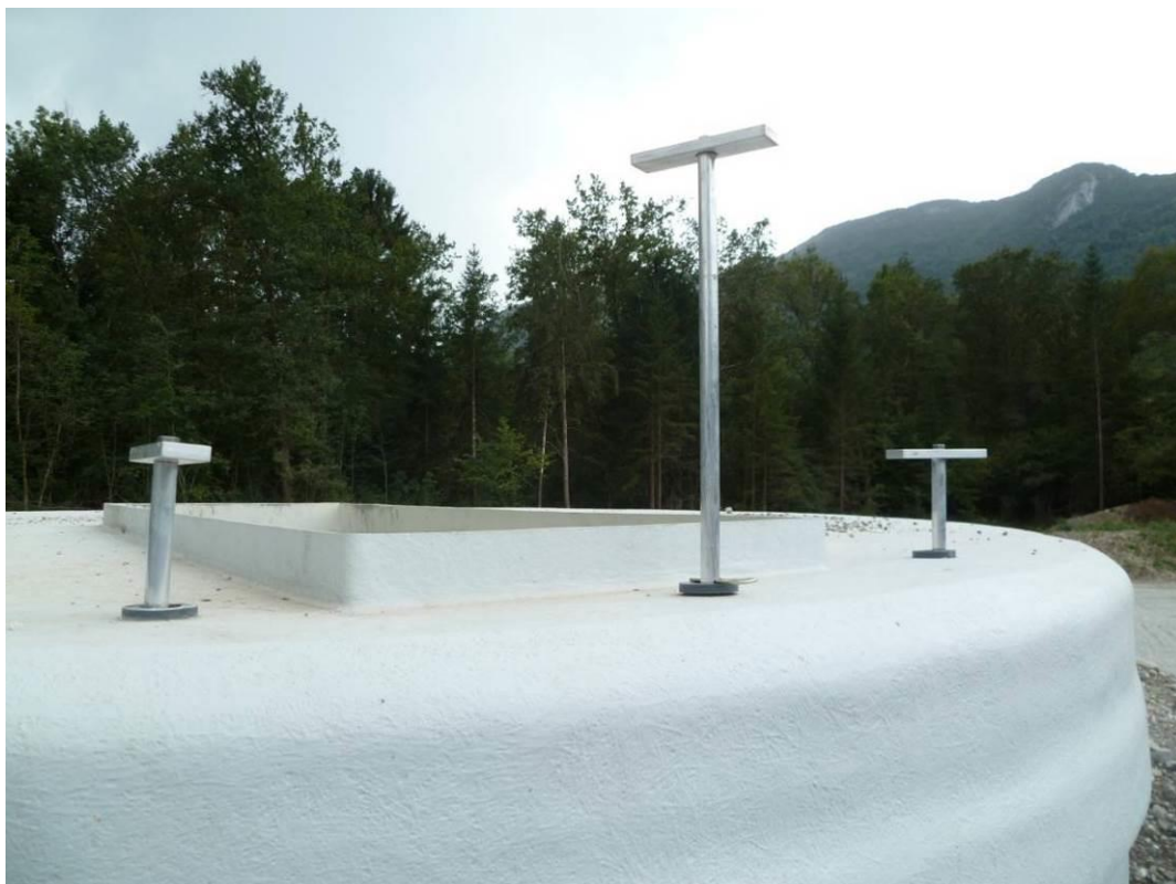
Poignées de sélection manœuvrable de l'extérieur de l'ouvrage de stockage