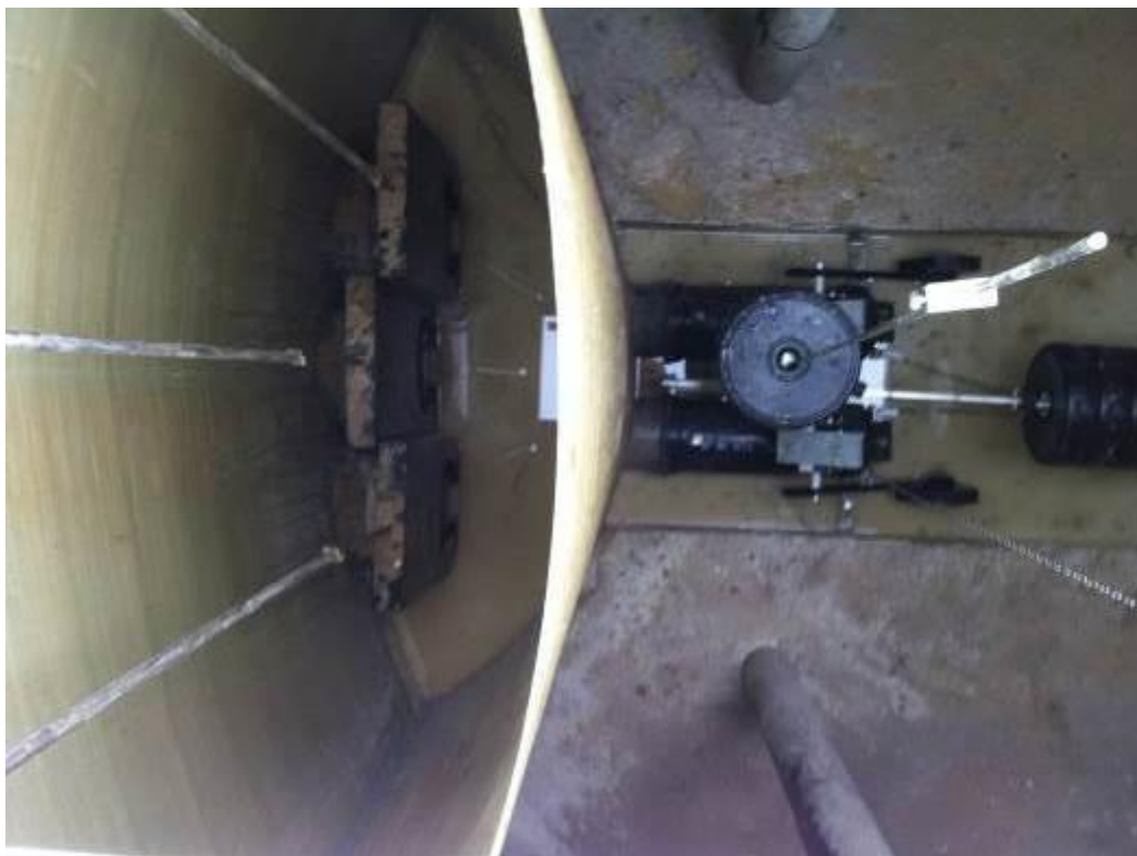
Vue de dessus cloison posée avec les équipements installés : Mobile de chasse à clapet double et système de répartition intégré (RVI DN 250)