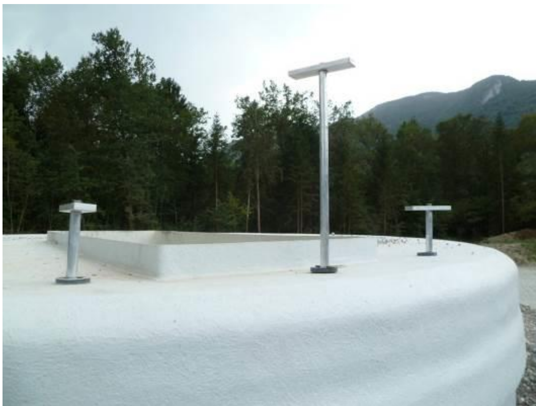
Poignées de sélection manœuvrable de l'extérieur de l'ouvrage de stockage