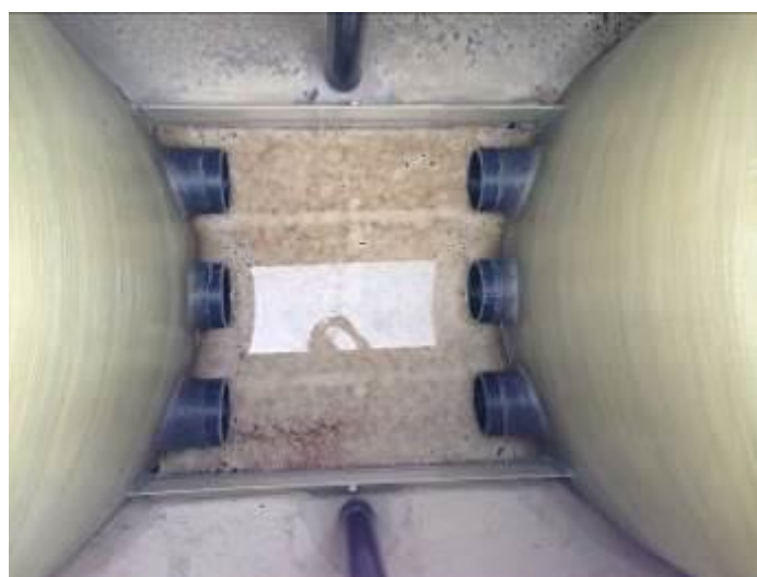
Zone de stockage avec deux compartiments RVI-E