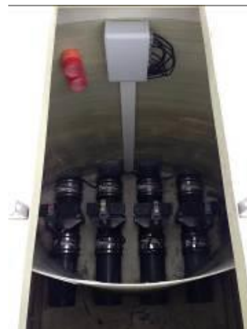
Quatre vannes électriques avec boîte de raccordement et arrivée des gaines