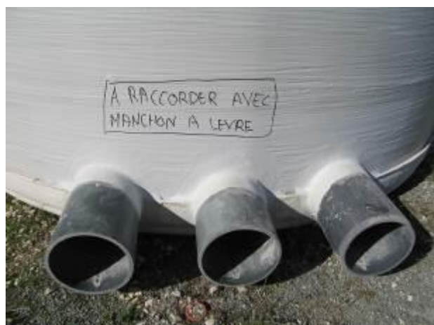
Sorties vers les filtres de premier étage