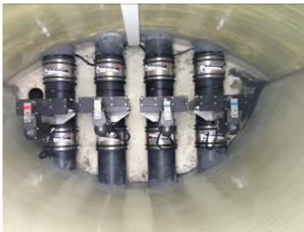
Quatre vannes électriques