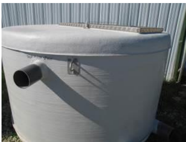
Cuve avec RVI-E