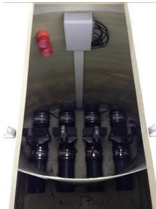
Quatre vannes électriques avec boîte de raccordement et arrivée des gaines