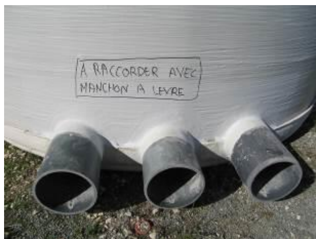
Sorties vers les filtres de premier étage