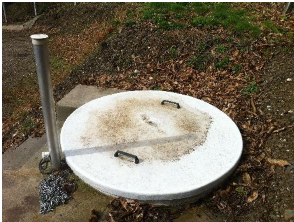
Chasse Ø 1500, Trappe d'accès Ø 1500 en polyester (capot fermé)