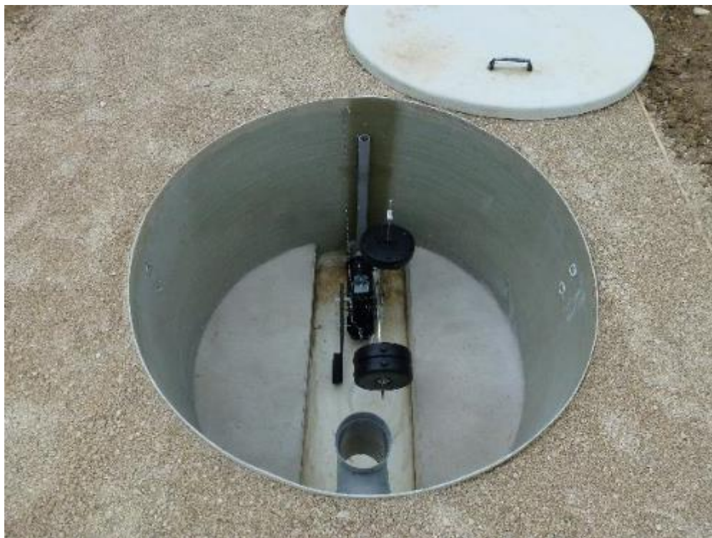
Chasse Ø 1500 à clapet (hauteur 1,10m), volume maximum 900 litres. Trappe d'accès Ø 1500 en polyester (capot fermé)