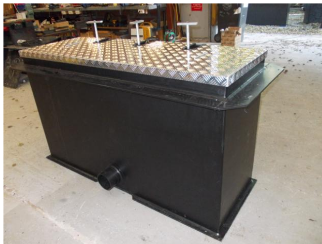
Photo non contractuelle : Vue de l'extérieur de l'ouvrage avec poignée de manœuvre extérieur