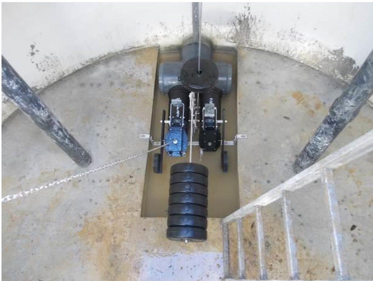
Mobile de chasse à clapet double 160 avec fixation de nez de clapet

Percer un trou \varnothing 8 traversant la pièce de jonction et le tube, puis serrer le boulon \varnothing 8 modérément en veillant à placer la tête dans le corps, double écrou et rondelle à l'extérieur.