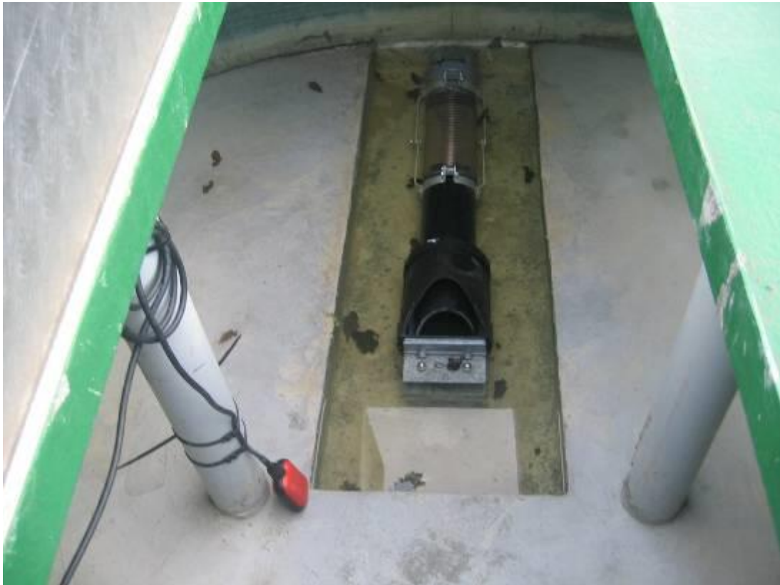
Mobile de chasse pendulaire :

Vérifier enfin que les axes d'articulation soient libres en rotation.